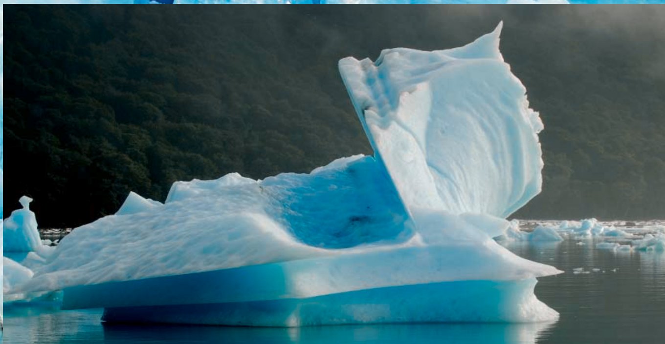
↑ Témpano desprendido del glaciar Upsala . → Pared del glaciar Spegazzini .