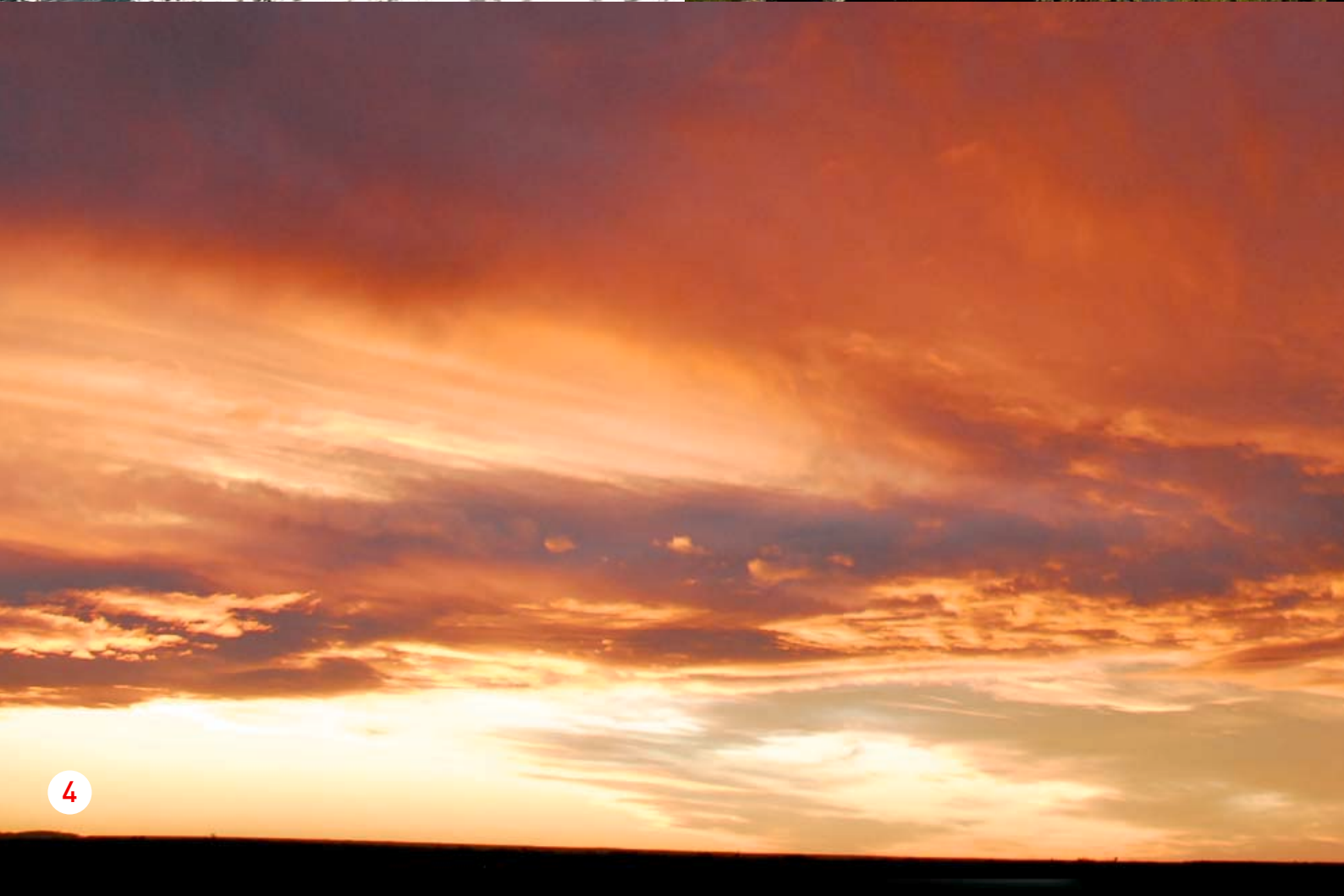
↑ 1- Salto de una ballena Franca Austral. 2- Paisaje del Parque Nacional de Ushuaia. 3- Cormoran roquero en pleno vuelo. 4- Atardecer en la Patagonia. 5- Un grupo de Guanacos 6- Una pareja de Cóndores (el ave más grande del planeta) en su nido.